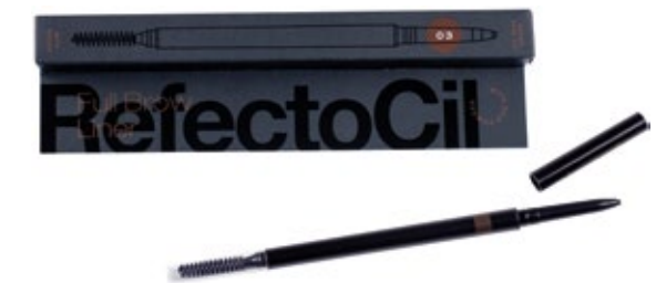
FULL BROW LINER N°03 OSCURO XT2005926