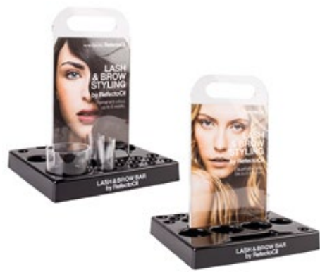
EXPOSITOR LASH & BROW VACIO XT2005894