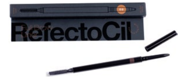
FULL BROW LINER N°02 MEDIO XT2005925