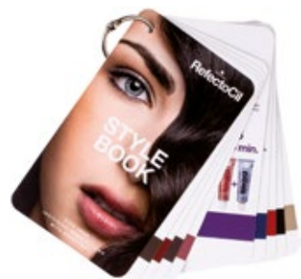
LIBRO DE ESTILO XT20029071