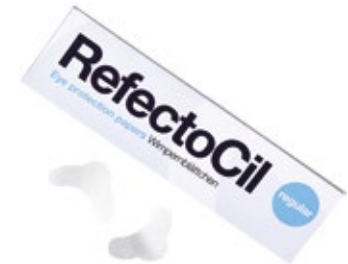
Protección contra el tinte de la piel. 96 unidades. PAPEL PROTECTOR DE OJOS (96 uds.) XT2005719