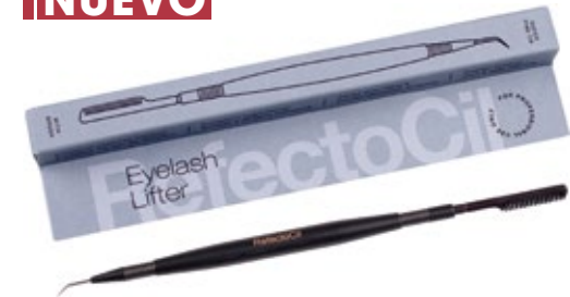
EYERLASH LIFTER XT2005555