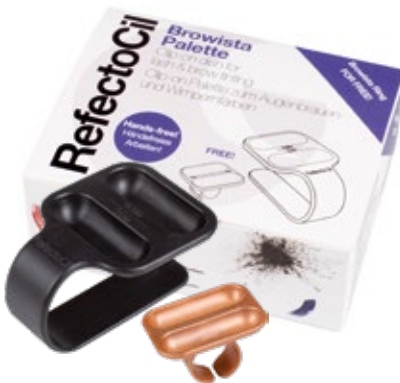
RefectoCil Browista Palette. Muñequera y anillo. Ambos productos son adecuados para diestros y zurdos. Son resistentes y prácticos, la superficie es resistente a los productos químicos y son fáciles de limpiar.

CONSEJO el color no gotea, incluso si pone la paleta o el anillo al revés.