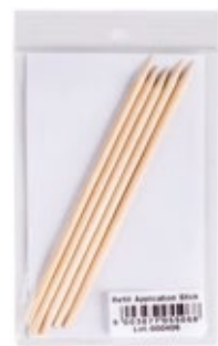
EYELASH PALO DE ROSA (5 uds.) XT2005506