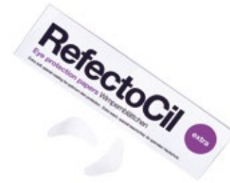
Protección de la piel contra el tinte, recubrimiento especial. 80 unidades. PAPEL PROTECTOR DE OJOS EXTRA (80 uds.) XT20057918