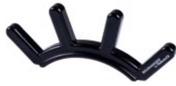
BRUSHANIZER SOPORTE PARA PINCELES XT20005706