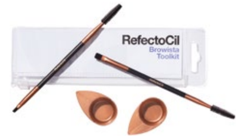
El cepillo ancho es ideal para cubrir las pestañas con tinte, el más pequeño para un trabajo preciso en las cejas. 2 platos de aplicación y una práctica bolsa para almacenamiento. JUEGO MINI JOFAINA Y PINCELES XT2005757