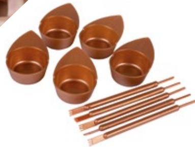
SET DE APLICACIÓN MINI Trabajo y aplicación del tinte prácticos. • 5 unidades de mini boles cosméticos. • 5 unidades palo de tinte. SET MINI JOFAINAS XT20057671