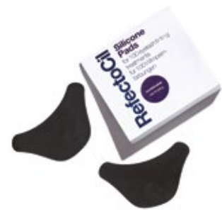
ALMOHADILLAS DE SILICONA Autoadhesivas, se pueden utilizar hasta 100 veces! 2 unidades. REFECTOCIL SILICONE PADS XT2005762