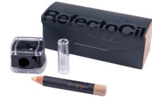
SET BROW HIGHLIGHTER XT2005927